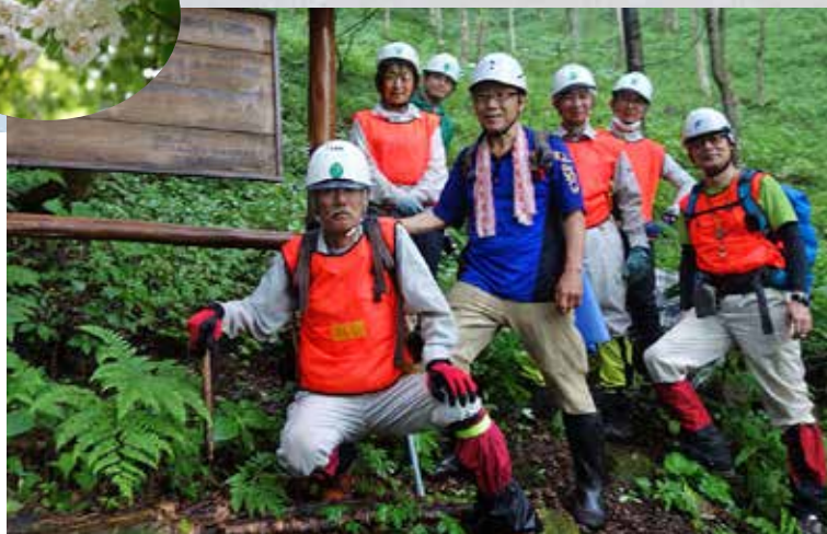
A 班 2001 年度植栽地前で