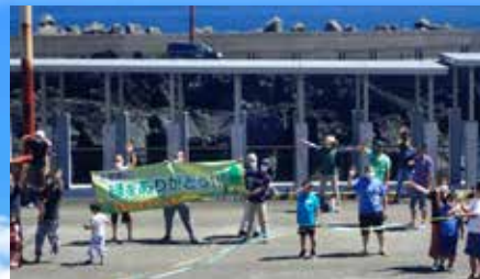
三池港で村の方の盛大なお見送り