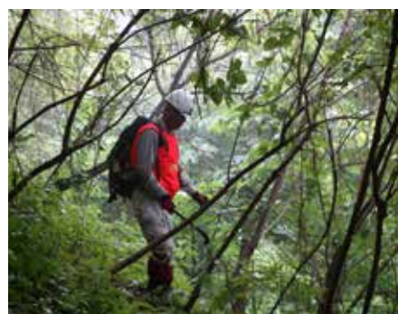
2012 年度植栽地はツルだらけ