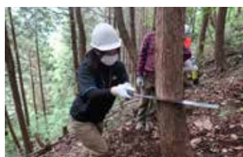
初めての間伐、なかなかいいね