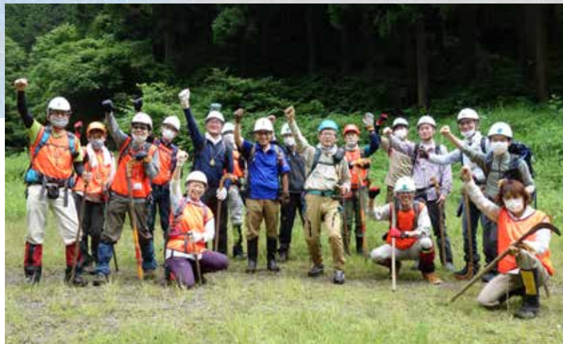
A 班、今日も元気に出発するぞぉ～っ！

● 一丁平の草刈りは、蒸し暑かったですが 本山リーダーの仕切りで完璧に終わること が出来ました。