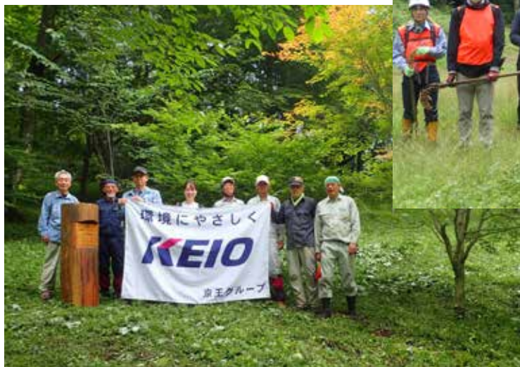
一丁平、キレイになりました