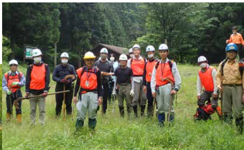
B 班 出発前