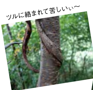
ツルに絡まれて苦しい～