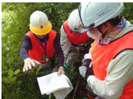
我々の作業エリアは・・・フムフム