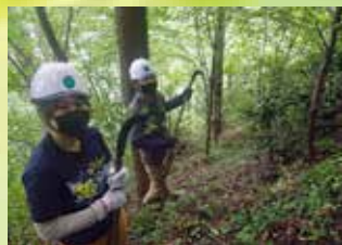
ツル切り体験 スッキリしました

この日は、風の通らない山道を歩いていけば汗が噴き出してくるような天気の良い日でした。今回はまずツル切りを体験させて頂いたのですが、暑さもさることながら、柔らかい土の積もった急斜面はとてもよく滑り、安定する足場を見つかるのにも一苦労です。そんな状況で、皆さんは私