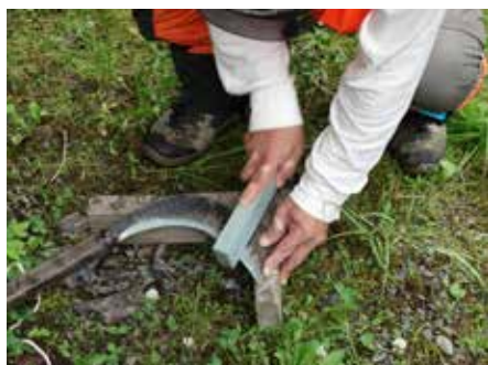
切れるようになったかなあ～？