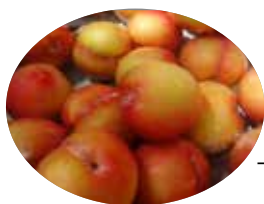
下山後のお楽しみ、みずみずしい～