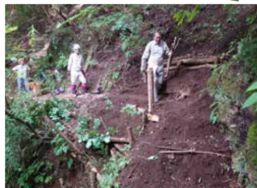
作業道、補修完了！歩きやすくなりました