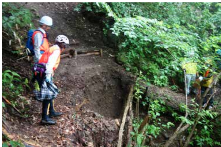
まあ～これは大変！道補修がんばってくださいね♡