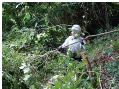
これをどけて、明るい森の出来あがりい～ッ！