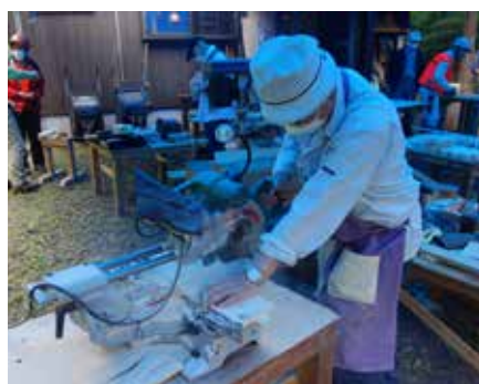
ベース小屋裏ではものづくり班活動中