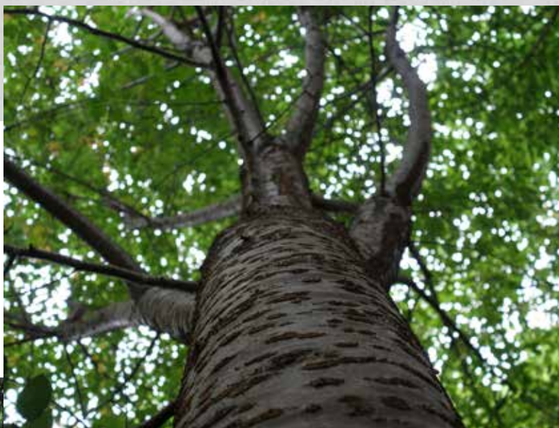
植樹から10年、こんなに大きくなりました