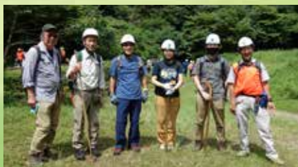
出発前 ベースにて