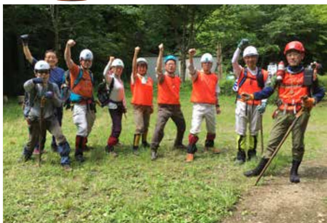
A 班 出発前