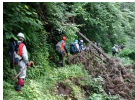
前はここクルマ通れましたよね