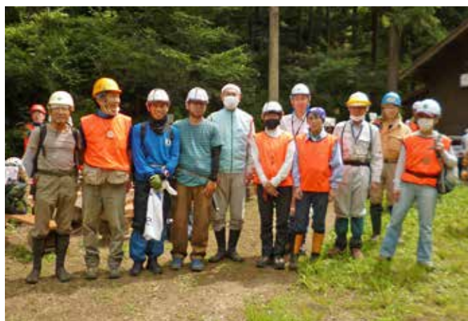
B 班 出発前