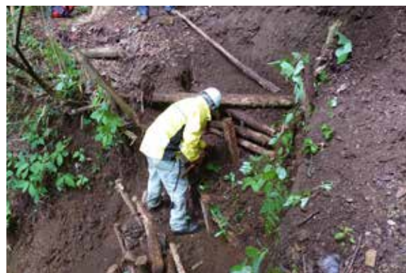
ハイ、がんばってます