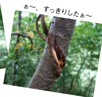
あ～、すっきりしたあ～