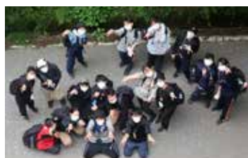
脱落者なく、全員無事下山できました

5月15日の日曜日、滋慶学園 TCA の学生向けに森林体験教室が開催された。この教室は 2015 年から始まり、昨年度は新型コロナの影響で中止となったものの、ほぼ毎年サポート役で参加してきた。