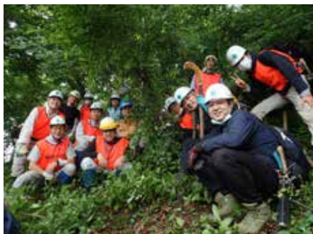
B 班 作業を終えて